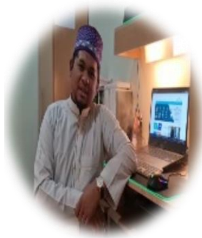
دولة إندونيسيا - اللغة (باهاسا ميلايو)