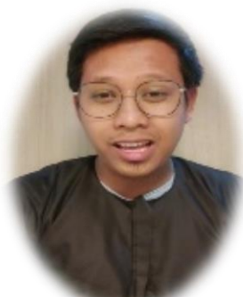
دولة الفلبين - اللغة (الفلبينية)