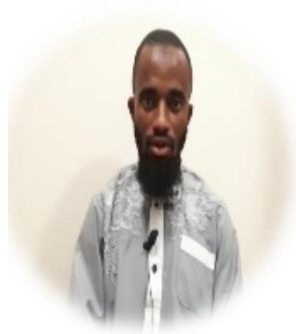
دولة الكونغو - اللغة (لينغالي)