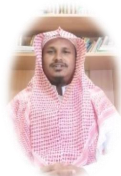
دولة بنغلاديش - اللغة (البنغالية)