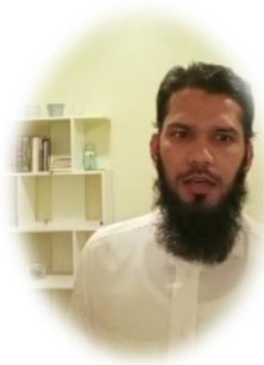
دولة الهند - اللغة (الأردية)