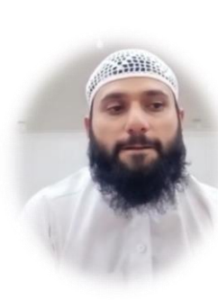
دولة إيران - اللغة (الفارسية)