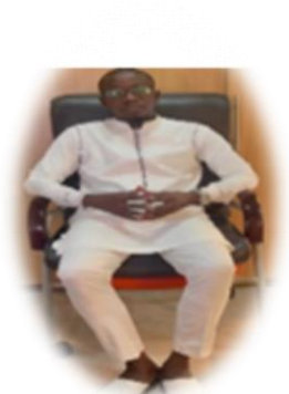
دولة ساحل العاج - اللغة (البمبرية)