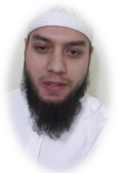
دولة روسيا - اللغة (الروسية)