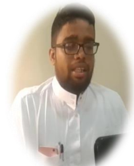
دولة سيرلانكا - اللغة (تاميلي)