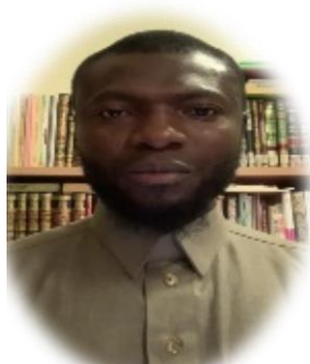
دولة غانا - اللغة (هوسا)