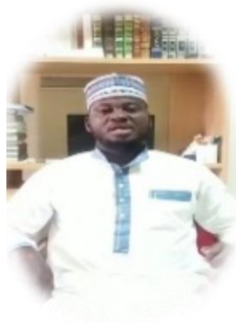
دولة غانا - اللغة (داغوبا)