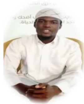
دولة بوركينا فاسو - اللغة (موري)